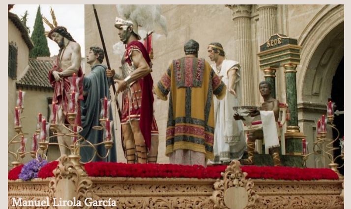
Manuel Lirola García

Poco duraría esta disposición pues en fotografías del año 64 ya aparecen ambas figuras en diferente posición; sedente sobre el estrado Pilatos, y arrodillada ante él implorando la liberación de Cristo Claudia Prócula como actualmente se pueden contemplar en el paso de misterio. Pero no sería este el último cambio ni mucho menos. Con el pasar de los años el Señor de la Sentencia procesionó en ocasiones solo sobre su paso e incluso en andas en los años difíciles de los 60 y 70 ante la escasez de costaleros asalariados. Ya en los 80 volvió a procesionar el paso completo, apareciendo de nuevo el procurador romano de pie, en diálogo con la imágenes del sanedrita y el soldado romano mientras se lava las manos. El último cambio, en espera de las nuevas figuras de este paso, se produjo en 2008 cuando de nuevo Poncio Pilatos vuelve a situarse sentado sobre el estrado. Sería esta la última alteración sufrida por las figuras secundarias de Jesús de la Sentencia en sus ya sesenta años de existencia.