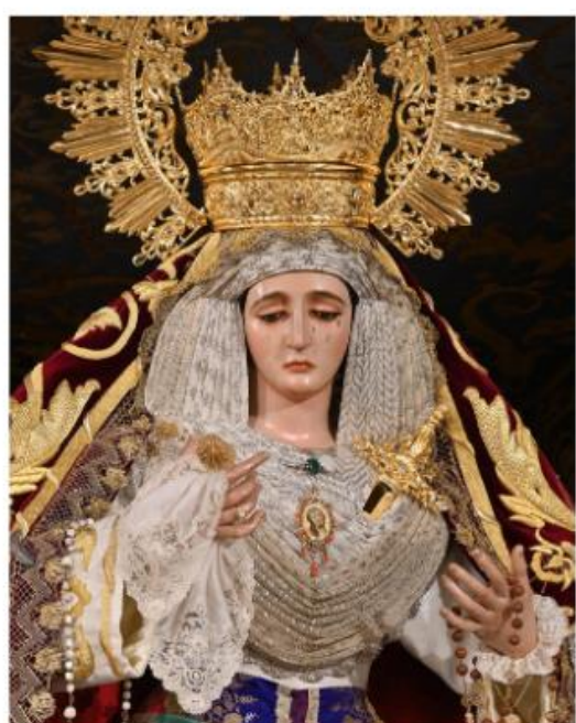
VESTIMENTA DE SALIDA