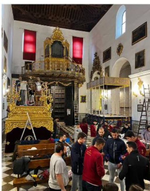
MONTAJE DE PASOS