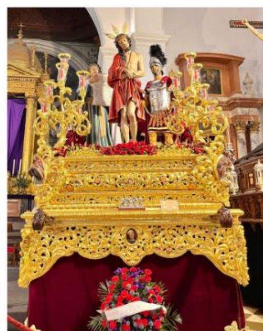
MONTAJE DE FLOR