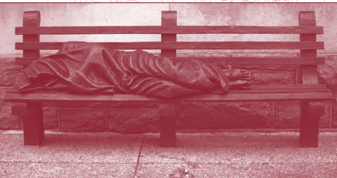
Imagen: "Jesús sin techo", escultura de Timothy Schmalz.

Pero este proyecto tiene vocación de futuro de forma que no sea solamente en estos meses sino a ser posible el resto del año. Para esto hemos estado en conversaciones con una congregación religiosa que dispone de unos espacios amplios y dignos para llevarlo a cabo. Y ésta es nuestra meta más deseada. Mientras tanto hemos llegado a unos acuerdos económicos con varias pensiones de la ciudad para que puedan acoger a los hermanos que viven en la calle. Y cumpliendo unos requisitos